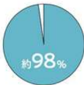
日本におけるオフィスの規模(スタッフ数)

それに加えてナイキでは、知識・創造を誘発する仕掛けを盛り込んだオフィスづくりを行う【クリエイティブ100人オフィス】