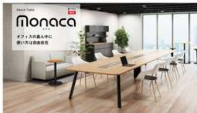
ナイキ本社ショールーム