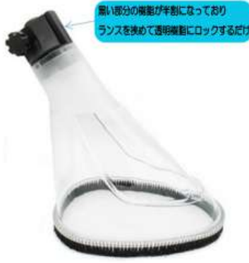
※ショートランスには使用出来ません。

今回はクランツレの人気商品のひとつ、洗浄水飛散防止アクセサリ「スプレープロテクター」のご紹介をさせていただきます。