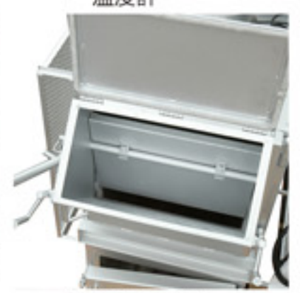
一次燃焼室プロフ