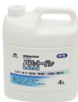
シャインクリアバストイレ除菌洗浄液 4L

みで効率的に水回りの清掃を行うことが可能な点です。次に4つの特長を説明いたします。 ①洗浄：密着泡と独自の洗浄成分の作用で汚れをスッキリ落とします。 ②除菌：対象面に生育する菌をしっかりと除去します。※1 ③消臭：緑茶エキスと爽やかなシトラスミントの香りで気になるニオイを消臭します。 ④防汚：新開発の表面防汚コート成分で、洗浄後も汚れの付着を抑制します。 (防汚技術関連特許 3件出願済) このように多くの効果があり、水回りの清掃の効率化を図ることが可能です。 その他の特長といたしましては、泡が塗布面に密着することで、垂れにくくなっており、洗剤の塗布しすぎ防止につながります。新開発の表面防汚コート成分は清掃する度、清掃面がコーティングされるため、日々発生する汚れを抑制し落とすやすくなることができます。 また、原液で使用いただけますので面倒な希釈作業も必要ございません。 ※1すべての菌を除去するわけではありません。 こういった日々の作業の効率化は目には見えませんが、積み重ねていくことによって非常に業務時間や作業時間に影響する部分となります。これからの業務改善にいかがでしょうか。 山崎産業株式会社の商品が皆さまの業務の一助になれば幸いです。