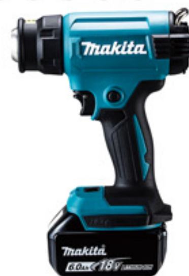
充電式ヒートガン HG181DZK

また、温度調整ダイヤルをダイヤル1に、風量調整ダイヤルを2にすることで、ノズルや相手材の冷却が可能です。付属のノズルと別売品のノズルやスクレーパーを使うことで、様々なシーンに活躍できます。