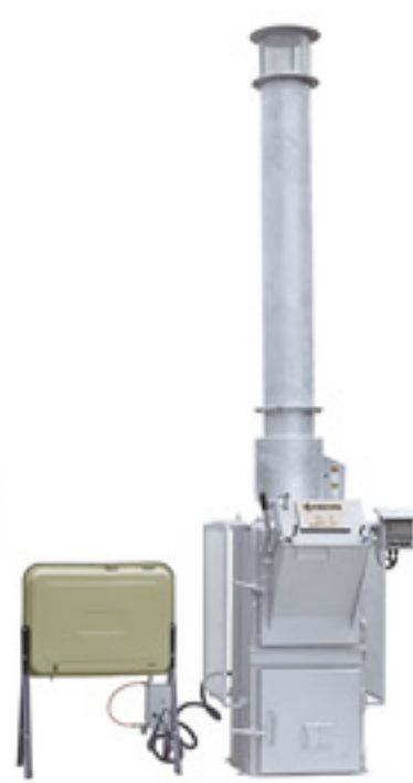
二次燃焼バーナー