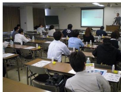
過去のセミナー風景