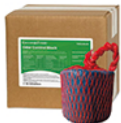
オダーコントロールブロック

今まで水質改善が難しかった工場や病院でも2週間程で排水基準以下に改善出来ました。費用はグリーストラップの流量や温度によってバクテリアプロックの溶け方が異なりますが、1カ月