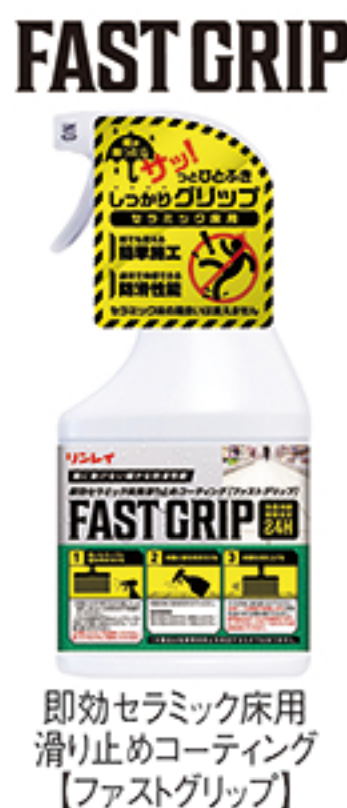
即効セラミック床用滑り止めコーティング【ファストグリップ】

いつも大変お世話になっております。平素はリンレイ製品をご愛顧頂きまして誠にありがとうございます。この度、弊社におきまして、これからの梅雨の時期に活躍出来る製品をご紹介させて頂きま