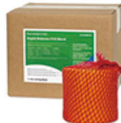
ラピッドリリースFOGブロック