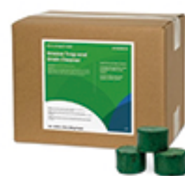
グリーストラップ&ドレインクリーナー