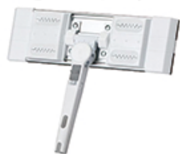
EFウィンドークリーナーハンディ

今回は、ムラの出やすい鏡やガラスの拭き掃除がしっかりできる「EFウィンドークリーナーハンディ」をご紹介します。かという、毎朝起きた時や出かける前の準備で、鏡を見て、髪ボサボサじゃないか？今日の顔色どうかとか、自分をチェックしますよね？その時にふと焦点を鏡に移したら、あれ？水滴跡ついているな、歯磨き粉飛んだ跡が残っている！上の方に埃が……とか目につくことがあります。私の家では掃除は週末と決めているのですが、気付けてしまったら気になりますので、キレイにしたくてたまりません。しかし、身長の低い私にとって鏡をキレイに拭き上げるのは重労働です。洗面台の鏡はそれ