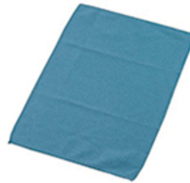
マイクロダスター

なりの高さがあったて、上の方を拭くためには背伸びをしなくてはならないからです。しかも背伸びで拭くと力がうまく入らず、仕上がりはムラになってしまします。そこで踏台を持ってきて拭き掃除をするのですが、鏡やガラスは光の加減でムラがとでも目立ちますので、キレイになるまでいろんな角度から見直し、拭き残しが無いかな、ムラになってはいないかとチェックを入念にするため、けっこう大変なのです。 そこでそんな私の悩みを解消してくれるアイテム、「EFウィンドークリーナーハンディ」をご紹介します。簡単に表すとクイックルワイパーの窓ガラス用みたいな感じで、長方形のホルダーに専用の「マイクロダスター」を装着して使用します。この形状のメリットは手に持って拭くと力が均一にならずムラにならず、長方形のホルダーが力を均一に保ってくれるのでムラになり難くきれいに仕上げることが出来ます。また私