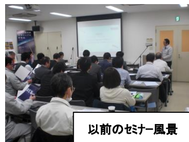
以前のセミナー風景